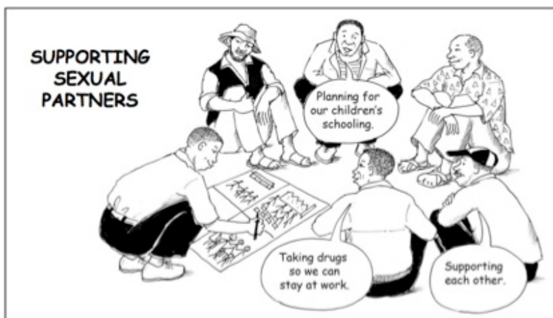
Imagen del manual Paso a Paso, ilustración realizada por Petra Röhr-Rouendaal

"[Paso a Paso] es la única intervención con hombres fuera de América del Norte en la que se observa una disminución de la violencia perpetrada por varones" (pág. 15).