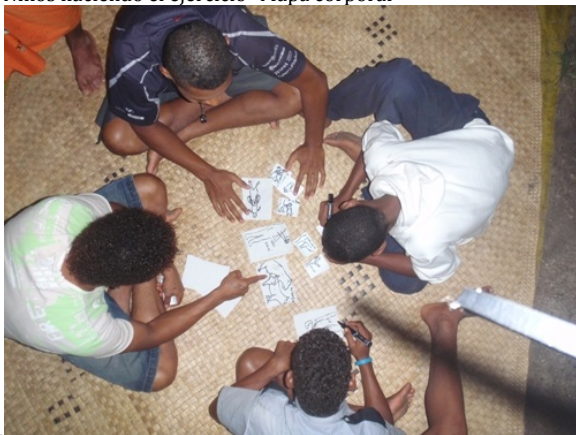
Niños haciendo el ejercicio "Mapa corporal"

"Antes del taller Paso a Paso creía que cuando mi marido me dejó fue culpa mía y me daba vergüenza porque creí que la gente de mi pueblo pensaba que fue porque yo no era una buena madre o esposa. No me gustaba vivir en mi comunidad y no participaba en las actividades de mi comunidad. Después de Paso a Paso y de hablar abiertamente sobre temas tabú como el sexo y las relaciones, me di cuenta de que muchas mujeres jóvenes tenían problemas como el mío... Las mujeres no tienen mucho poder en Fiji, pero Paso a Paso y las otras mujeres me dieron confianza."