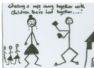
Chasing Away." Dibujo realizado por mujeres en una comunidad de Zimbabue. 1990. Redd Barna programa.

Pero esta definición no es suficiente: un informe realizado por las colaboradoras de Salamander Trust, Fiona Hale y MariJo Vázquez destaca que muchos de los problemas mencionados, como "el estigma y la discriminación" se entienden mejor en el contexto de la violencia de género. También incluye problemas que van desde el acoso sexual en el lugar de trabajo hasta la violencia institucionalizada que es la esterilización forzada o la existencia de leyes que prohíben a las mujeres heredar y disponer de tierras. Cualquiera de estas acciones constituye una violación de los derechos de todas estas mujeres.