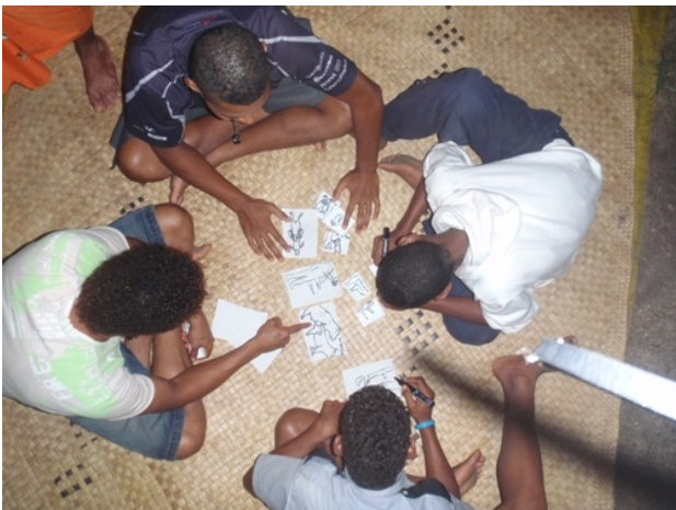
Les garçons font un exercice de Parcours en Fiji

Pour plus d'informations sur aucune des questions soulevées ici, contacter Albert Cerelala au albert.cerelala @ fspi.org.fj